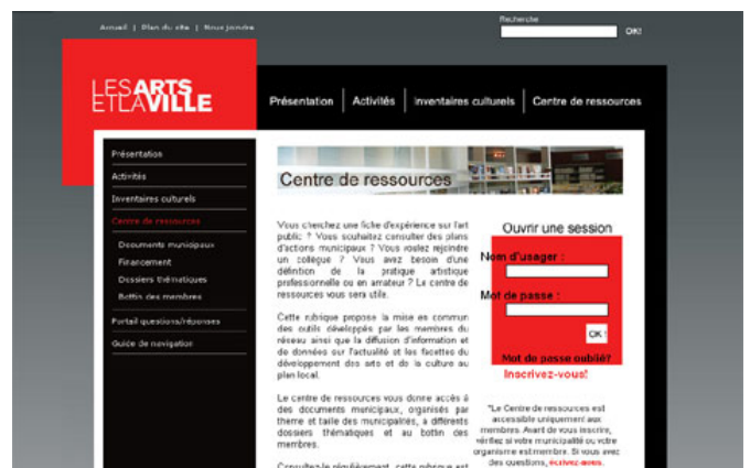
Page d'accueil du site et page d'accueil du Centre de ressources.