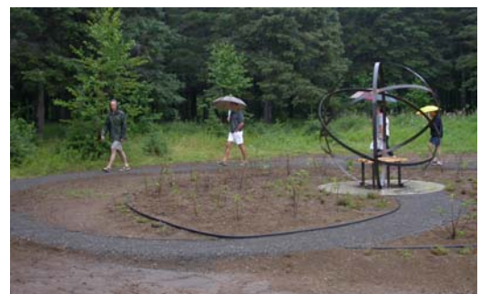
Jardin de Marsel Ritchie, 2007