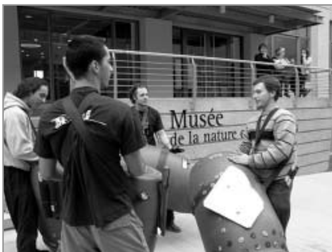
LE GROUPE TRIBAL À L'ENTRÉE DU MUSÉE DE LA NATURE ET DES SCIENCES DE SHERBROOKE

Par ailleurs, s'il est un constat qui semble de plus en plus s'imposer quant on parle de la vitalité de nos localités, c'est celui du rôle prépondérant que peut y jouer la culture, tant sur le plan économique que sur le plan social. C'est en tenant compte de ces paramètres que la coalition Les Arts et la Ville a souhaité soulever des réflexions sur le rôle des municipalités, des organismes ou institutions culturels, de l'entreprise privée, des artistes et des citoyens envers la vitalité culturelle locale.