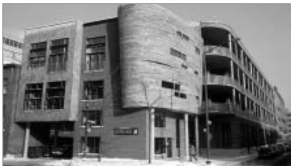
ATELIERS DU ROULEMENT À BILLES (AVANT ET APRÈS)

Le concept architectural de Florent Cousineau et Benoît Thénien est basé sur un système de coursives extérieures et de larges baies vitrées permettant une ouverture au quartier et aux passants. Le volume arrondi, la forme du bâtiment en pouce de bateau, une forme déjà présente dans plusieurs bâtiments du quartier, et l'utilisation du béton comme matériau de recouvrement offrent un élément architectural remarqué dans le paysage du quartier Saint-Roch.