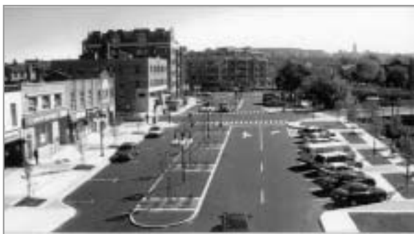
CENTRE-VILLE DE L'ARRONDISSEMENT MONT-ROYAL (AVANT ET APRÈS)

Afin de répondre aux attentes et besoins de ses citoyens, l'arrondissement Mont-Royal a redonné vie au patrimoine urbain de son centre-ville. Le projet comprend la transformation du terminus d'autobus en place publique, l'amélioration des liens piétonniers, l'agencement de larges trottoirs, la création d'une symétrie axiale et le développement d'axes visuels. Il est complété par la réduction des surfaces asphaltées au profit de plantations diverses ainsi que par l'intégration des deux parcs voisins.