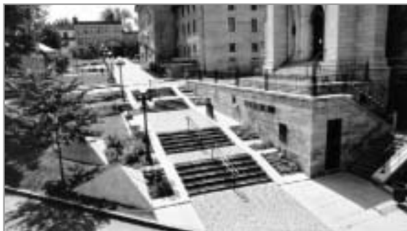
PLACE DE L'INSTITUT-CANADIEN (AVANT ET APRÈS)