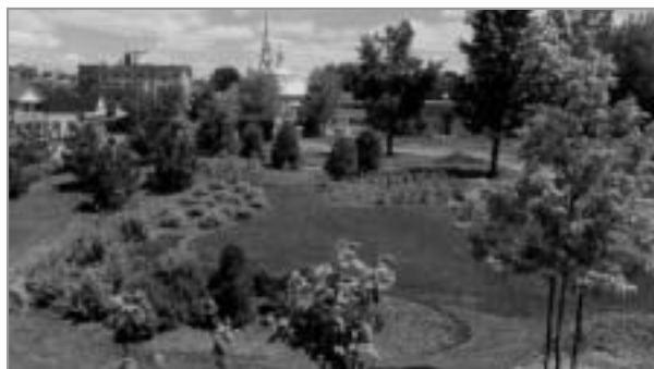
ARBORETUM SAINT-GEORGES (AVANT ET APRES)