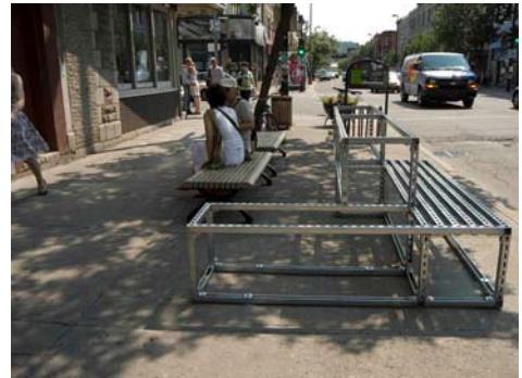
Installations du collectif Ekip

Dévoilée en deux temps, soit du 2 au 6 juillet et du 27 au 31 août, la présentation 2008 comprend deux volets : le volet commissariat et le volet concours. Le premier, conçu par le commissaire invité Stéphane Bertrand, s'intitule PEEP show [Paysages éphémères | Espaces publics] et compte sept œuvres, chacune relevant « du geste, d'un quotidien, de la précarité, de l'infiltration et du nomadisme dans la ville ». Par exemple, du 28 au 30 août, le duo danois RACA transformera la place Gérald-Godin en une bibliothèque nocturne à ciel ouvert, alors que le collectif Ekip porte sa réflexion sur le mobilier urbain de l'avenue du Mont-Royal en y combinant différents modules d'acier, du 27 au 31 août au parc des Compagnons-de-Saint-Laurent, coin Mont-Royal et Cartier.