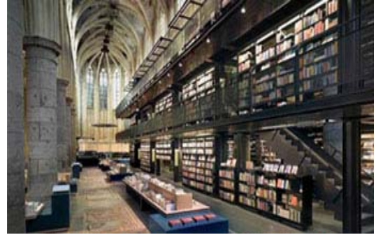
Intérieur de l'église de Maastricht

Le réseau de veille en tourisme propose, dans son bulletin électronique du 6 août 2008, un article consacré à des exemples de reconversion de patrimoine industriel, institutionnel et commercial. Ceux-ci illustrent comment une intervention patrimoniale peut servir de levier à la diffusion des arts et de la culture, ainsi qu'à la transformation d'espaces urbains sensibles (terrains en friche, bâtiments abandonnés, etc.). L'article présente, entre autres, le cas de la Tate Gallery de Londres (reconversion d'une centrale électrique désaffectée) et celui de l'église de Maastricht, aux Pays-Bas, dont