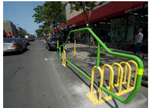
Projet 4 : 1

Le volet concours comprend les trois projets lauréats de cette année : Vert Bac, La rue des rêves et 4 : 1. Le premier, du collectif Vert Pétant, propose des sculptures faites à partir de bacs de recyclage des résidents, alors que le second est un événement d'art communautaire qui diffuse les rêves des gens du quartier, de manière sonore ou écrite. Le troisième projet traite de la place accordée aux cyclistes, alors que deux supports à vélos empruntant la forme d'une automobile ont été installés sur l'avenue du Mont-Royal.