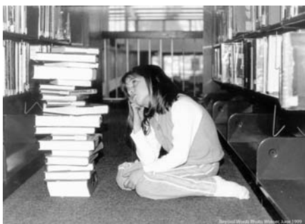
Where do I begin ?

Les tentatives pour faire retirer certains livres des rayons des bibliothèques américaines ont augmentées de plus de 20 % cette année par rapport à 2004. C'est ce que révèle une récente enquête menée par l'American Library Association (ALA). Des plaintes écrites sont surtout envoyées aux bibliothèques scolaires, en raison du contenu d'un livre jugé inapproprié. Les reproches les plus souvent formulés : contenu sexuel explicite, langage offensant et violence ou thématiques occultes.