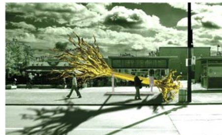
Lauréat 2006 (prix du public) : Un arbre, un contrat de K design

Paysages éphémères vient à peine d'annoncer les lauréats de sa deuxième édition, présentée du 26 juin au 3 septembre prochain, qu'il lance son appel de propositions pour le concours 2007. Il s'agit pour les participants de concevoir une intervention paysagère éphémère qui prendra place dans le décor quotidien du plateau sur l'avenue Mont-Royal à Montréal. Date limite de dépôt des dossiers : 26 mai 2006