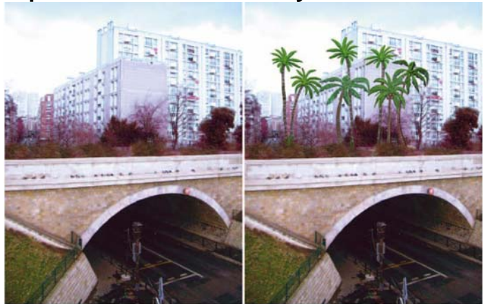
Mirage , œuvre de Bertrand Lavier

Le parcours du futur tramway parisien sera jalonné par neuf œuvres d'art contemporain. Confiées à des artistes contemporains de renommée internationale, ces œuvres seront installées à la mi-décembre au moment de la mise en service du nouveau tramway. Cofinancées par la région, avec le soutien du ministère de la Culture, elles donneront toute sa place à la culture dans l'espace public.