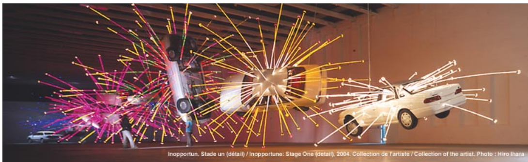
Cai Guo-Qiang, Inopportune. Stade un 2004, Neuf automobiles et tubes néons multicanaux séquentiels

Après Le Corps transformé et L'Arche de Noé , c'est au tour de Déroulement de l'artiste chinois Cai Guo-Qiang d'occuper la Cité de l'énergie de Shawinigan du 10 juin au 1 er octobre. Neuf voitures blanches desquelles émergent des tubes lumineux sont suspendues au plafond, neuf tigres grandeur nature transpercés de flèches, et l'épave d'un bateau de pêche japonais composent cette exposition organisée par le Musée des beaux-arts du Canada.