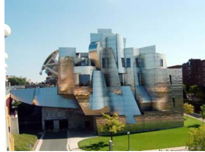
Le Weisman Art Museum, conçu par l'architecte Frank Gehry.

Vous connaissez St. Paul et Minneapolis ? Ces deux villes du Minnesota, riveraines du Mississippi et que l'on appelle les Twin Cities à cause de leur proximité géographique forment la 17 e agglomération des États-Unis, mais constituent le second meilleur endroit où vivre selon le Kiplinger's Personal Finance Magazine .