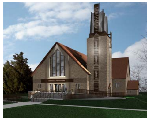
Voici à quoi ressemblera, une fois les travaux terminés, la nouvelle bibliothèque.

La Ville de Joliette et la municipalité de Saint-Charles-Borromée viennent de conclure un partenariat en vue de l'aménagement d'une bibliothèque dans un ancien bâtiment religieux. La Ville de Joliette a choisi de procéder, sans attendre de subvention, en raison de la vétusté du bâtiment abritant l'actuelle bibliothèque. En outre, l'exiguïté des lieux faisait en sorte que 40 % de la collection n'était pas directement accessible au public. Enfin, plus le temps passait et plus les coûts de construction augmentaient, diminuant d'autant l'avantage d'obtenir une subvention. Les travaux de réaménagement du bâtiment débiteront en juin.