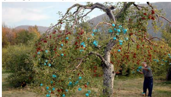
Tsunami des bleus , par Bill Vazan, édition 2007

La deuxième présentation de Créations-sur-le-champ land art Mont-Saint-Hilaire se déroulera du 15 au 19 octobre dans le verger du Pavillon de la pomme de Mont-Saint-Hilaire. Cet événement repose sur le principe de sortir l'art des musées et de créer des œuvres d'art à partir de composantes de la nature et de matières brutes. Cette année, la Ville de Mont-Saint-Hilaire accueillera 13 artistes de la région et d'ailleurs au Québec, avec lesquels les visiteurs pourront échanger.