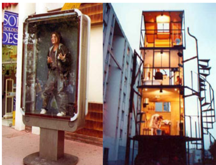
Tout va bien , photo © Jean-Louis Fernandez, www.kumulus.fr

Kumulus est une compagnie de théâtre établie en France qui a choisi de planter son décor dans l'espace urbain. Les pièces jouées par les acteurs de la troupe proposent des réflexions sur l'homme et son environnement et surprennent les spectateurs dans leur vie quotidienne. Les citoyens se trouvent confrontés à des performances où la réalité et la fiction s'entremêlent, où il est difficile de distinguer le vrai du faux.