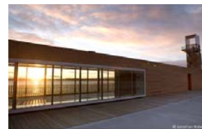
« Quai des Cageux » est mérité le premier prix dans la catégorie « architecture commerciale ».

Source : Communiqué de la Commission de la capitale nationale de Québec , 27