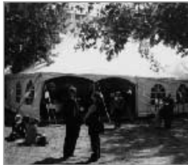
Le déjeuner du jeudi fut offert sous chapiteau