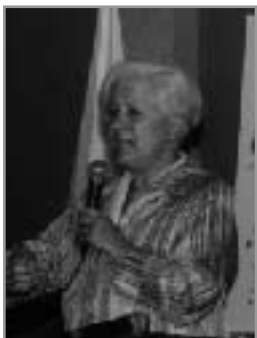
Louise Harel, ministre d'État aux Affaires municipales et à la Métropole