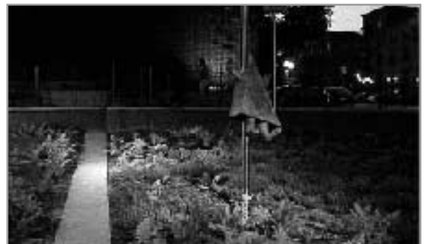
Le Jardin de Lyon à Montréal