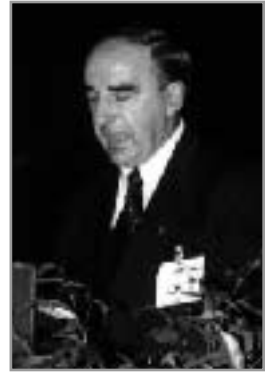
Claude Gladu, maire de la Ville de Longueuil