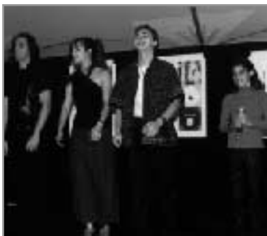
Des élèves de l'École Nos voix Nos visages de Longueuil

« citoyen » de la Ville s'est traduite par une offre de services à proximité. Ainsi, deux points de service dits « bibliothèques de poche » ont été ajoutés à la bibliothèque centrale.