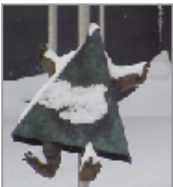
Le Jardin de Lyon à Montréal