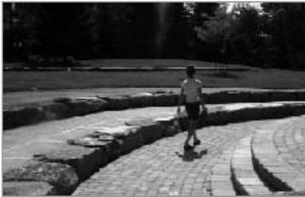
Amphithéâtre de la Place de la Francophonie

C'est un parc urbain, à proximité du centre-ville, dédié à la culture francophone et une véritable galerie d'art à ciel ouvert où sont exposés des textes poétiques et les sculptures des IV e Jeux de la francophonie.