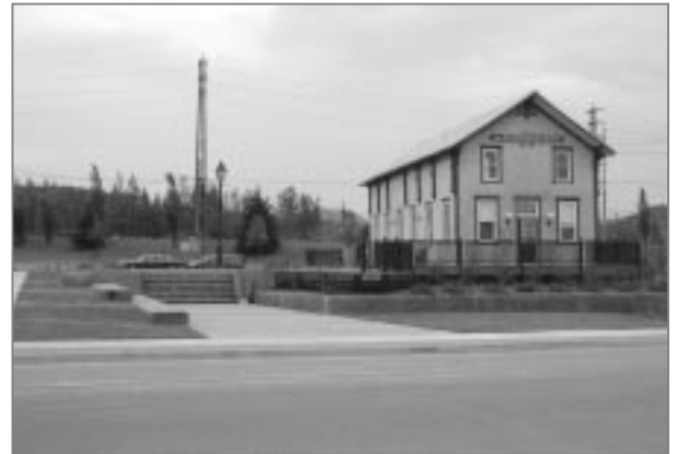
PLACE DE LA STATION DES ARTS

La thématique de la Station des arts tourne autour d'une ancienne gare restaurée. Ce bâtiment, première station ferroviaire du canton de Thetford, fut érigé en 1878. La station contient notamment deux salles d'exposition. À l'avant de l'édifice, une petite scène pour spectacles en plein air, avec un agora urbain pouvant accueillir environ soixante personnes, a été installée. Sur le côté du bâtiment, porte-bagages, feux de croisement et autres éléments ferroviaires seront intégrés au décor et rappelleront l'importance du chemin de fer dans l'histoire et le développement économique de Thetford Mines. Le mobilier urbain, les lampadaires, la signalétique, les éléments végétaux et les allées piétonnes s'harmonisent au site et complètent le projet.