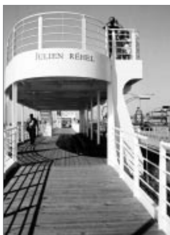
LA PROMENADE DE LA MER

La Promenade de la mer : image maritime Concepteur : Pluram Urbatique (Québec)